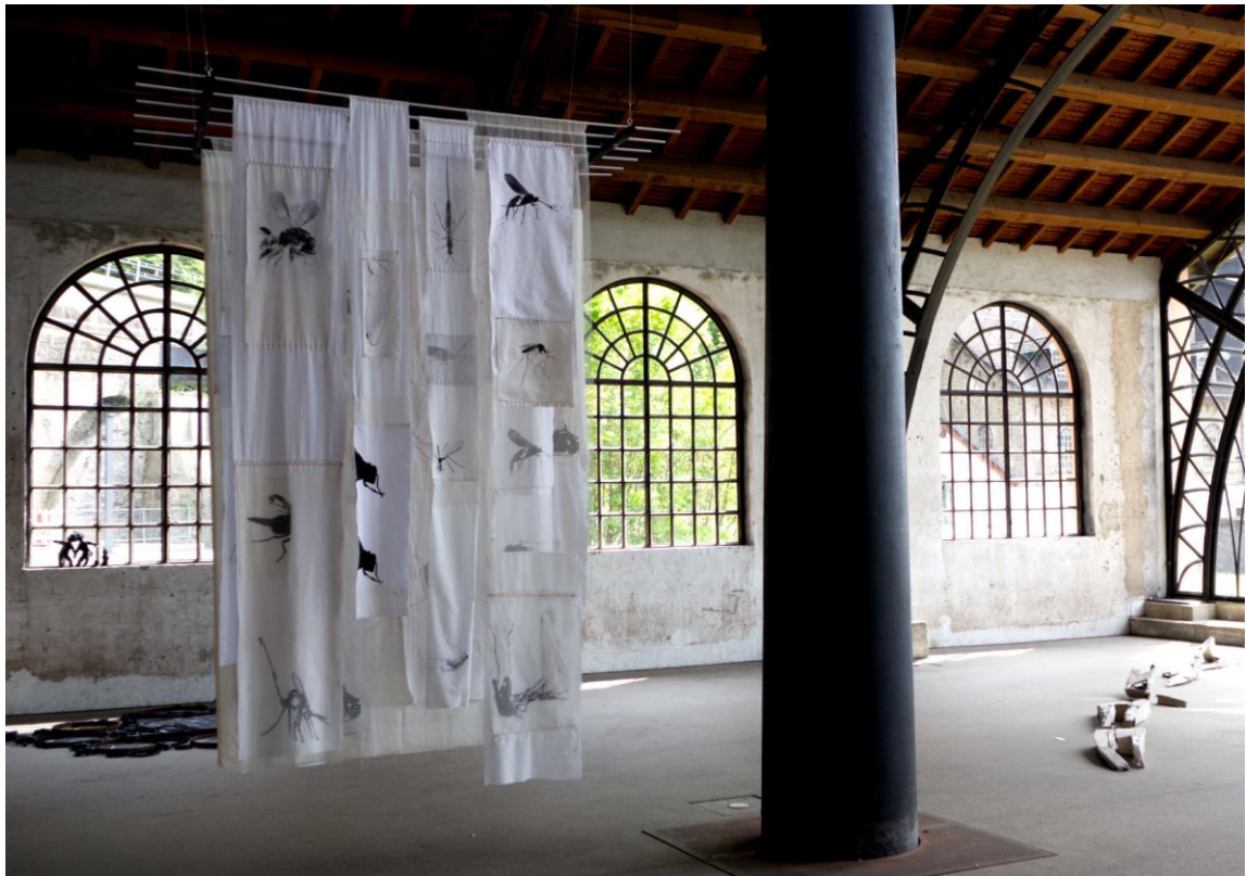
„Von Mücken und Fliegen“, Ausstellungsansicht Sayner Hütte April / Juni 2024 Installation, div. Stoffe, Gaze, Siebdruck, Fototransfer, Tusche, Fadenzzeichnung, Alustangen, ca. 250 cm h x 150 cm b x 80 cm t