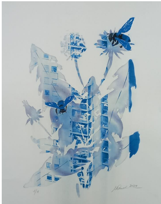
„Löwenzahn“, 2024 Cyanotypie mit Reduktionsdruck auf Bütten, 50 cm x 40 cm