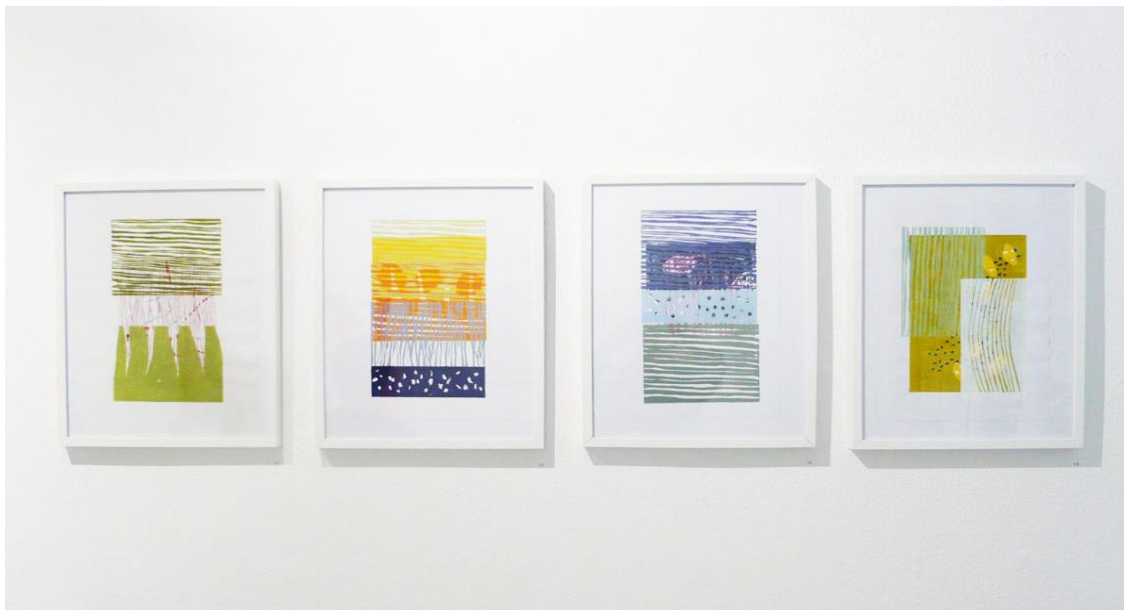
Ausstellung - „so was von analog“, 2024, BBK Wiesbaden