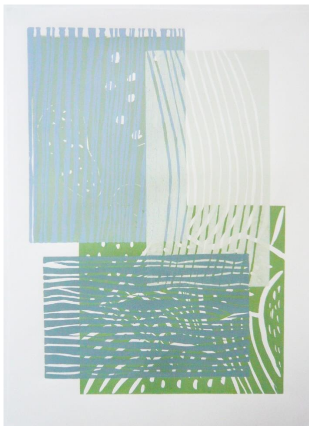
Form-Variation II, 2024, WVZ 349 mehrfarbiger Linoldruck, Handabzug auf Papier 42 cm x 29,7 cm