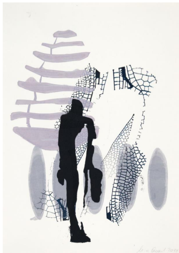
„tragen“, 2024, Siebdruck, Unikat, 41 cm x 29,5 cm