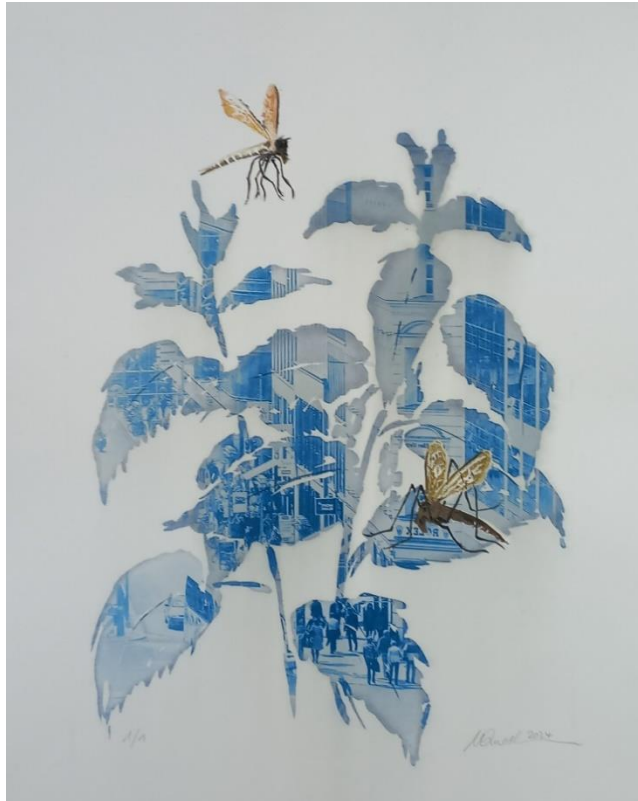
„Brennnessel“, 2024 Cyanotypie mit Reduktionsdruck auf Bütten, 50 cm x 40 cm