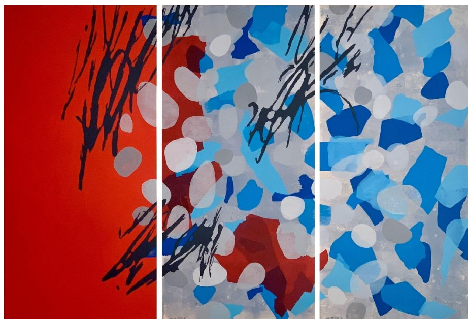
„Ad infinitum“, 2024, dreiteilig Linoldruck, Monotypie, Collage auf Papier, Holzrahmen, insgesamt 100 cm x 150 cm