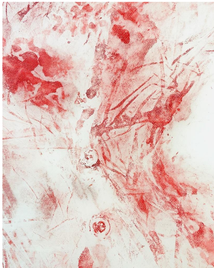
Unikat-Materialdruck auf Gaze (doppellagig) 120 cm x 65 cm, Detail, aus der Serie Von R.